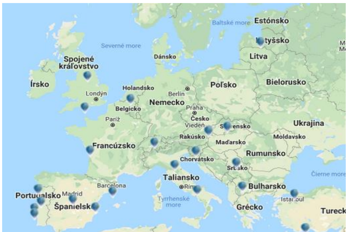
Obrázok 2 Inštitúcie s certifikovaným študijným programom UNWTO TedQual v Európe

V máji 2019 získala certifikát aj Katedra cestovného ruchu Ekonomickej fakulty Univerzity Mateja Bela v Banskej Bystrici pre študijný program Ekonomika a riadenie cestovného ruchu v druhom stupni štúdia. V krajinách Vyšehradskej skupiny ide o jediný certifikovaný študijný program, ktorý tak dokumentuje konkurenčnú výhodu štúdia cestovného ruchu na Ekonomickej fakulte Univerzity Mateja Bela v Banskej Bystrici. Gestorom študijného programu je Katedra cestovného ruchu, ktorá už 55 rokov formuje budúcnosť cestovného ruchu vzdelávaním študentov a spoluprácou so zainteresovanými subjektmi. Certifikát oceňuje jej dlhoročnú snahu vo vzdelávaní mladých ľudí, v práci s verejnosťou a výskumnej činnosti. Certifikácia študijného programu je zárukou pre študentov, že štúdium rešpektuje ich potreby, trendy na trhu práce a je v súlade s medzinárodne uznávanými štandardmi. Zamestnávateľom preukazuje, že študent má relevantné vedomosti z odboru a je schopný rešpektovať etické princípy rozvoja cestovného ruchu. Pretože kvalita vzdelávania je v dnešnom vysoko konkurenčnom prostredí určujúcim faktorom presadenia sa na trhu práce.